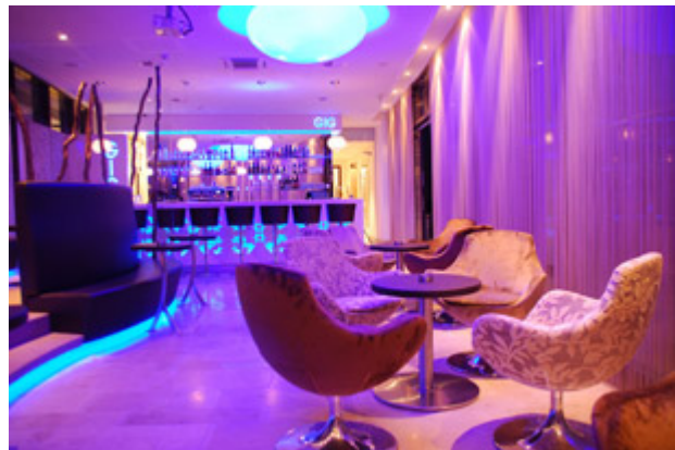
Top-Style in der GIG-Bar