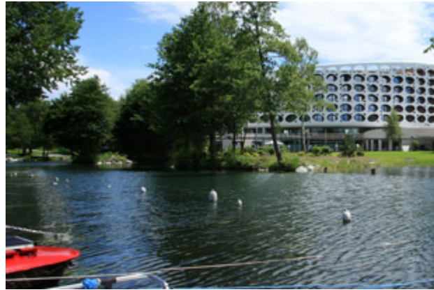
die romantische Kulisse der Lend-Lagune

Das Wochenende vom 10. - 13. September in Pörtlach ist Pflicht, im Lindner Seepark Hotel wird's zur Kür!